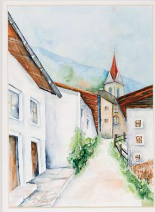
4 Bergerweg, Aquarell Papier, ca. 27 x 37 cm

Ausstellungen: 1997 "Kunstcafe Rössl", Telfs, 1998, 2001, 2004, 2007 Gemeinschaftsausstellungen, Stams, 2017 Gemeinschaftsausstellung Mieming, 1998 Gemeinschaftsausstellung Pfaffenhofen, 2002 Museumsgalerie Tarrenz, 2005 Volksschule Flauring.