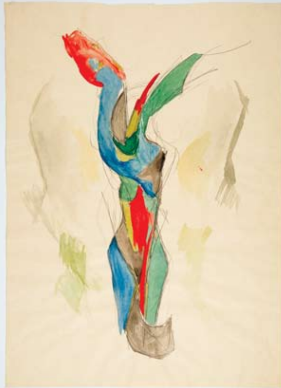
14 Torso, colorierter Entwurf, ca. 45 x 62 cm