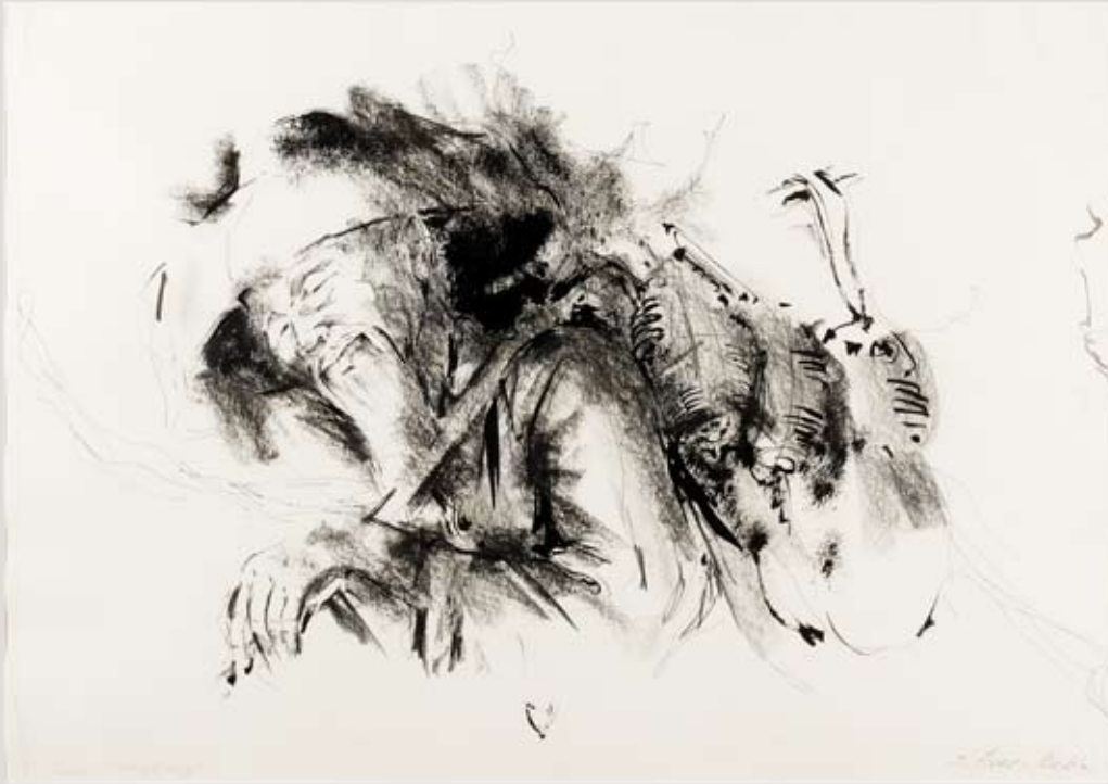
13 Aberdeen (Hongkong) Tusche, schwarze Kreide Papier, ca. 60 x 41 cm

Friedel Auer-Miehle ist 1914 in Lechaschau geboren (gest. 2004, Innsbruck) und studierte in München an der Akademie für angewandte Kunst. Mehr als 100 Ausstellungen in Übersee und Europa; Trägerin des Ehrenzeichens für Kunst und Kultur der Stadt Innsbruck.