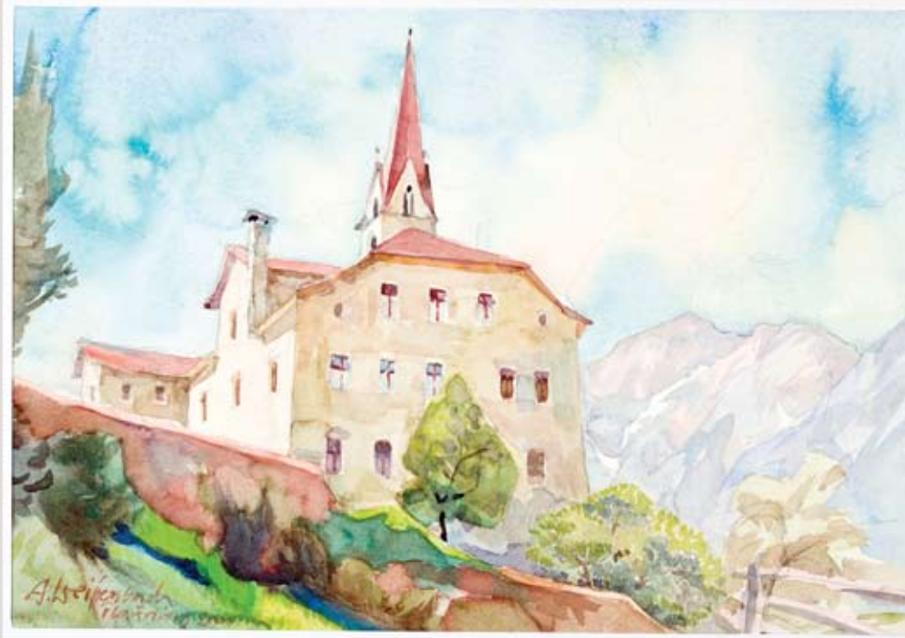
15 Risschloss, Aquarell Papier, ca. 50 x 34 cm

geb. 1925 in Imst, studierte an der Akademie der bildenden Künste in Wien, ist freischaffender Künstler und unterrichtete u.a. an der Sommerakademie, die ihn regelmäßig mit SchülerInnen nach Flauring führte. Heute lebt und arbeitet er in Völs und Imst.