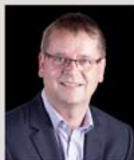
Vizebürgermeister Adolf Waldhart