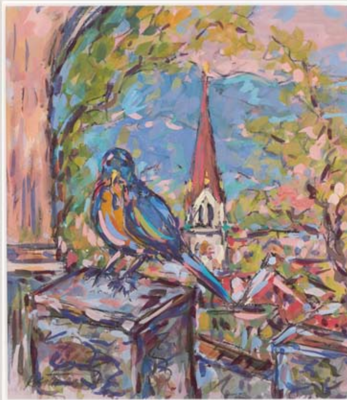
8 Amsel am Kalvarienberg, Tempera, Kohle Papier, ca. 26 x 35 cm