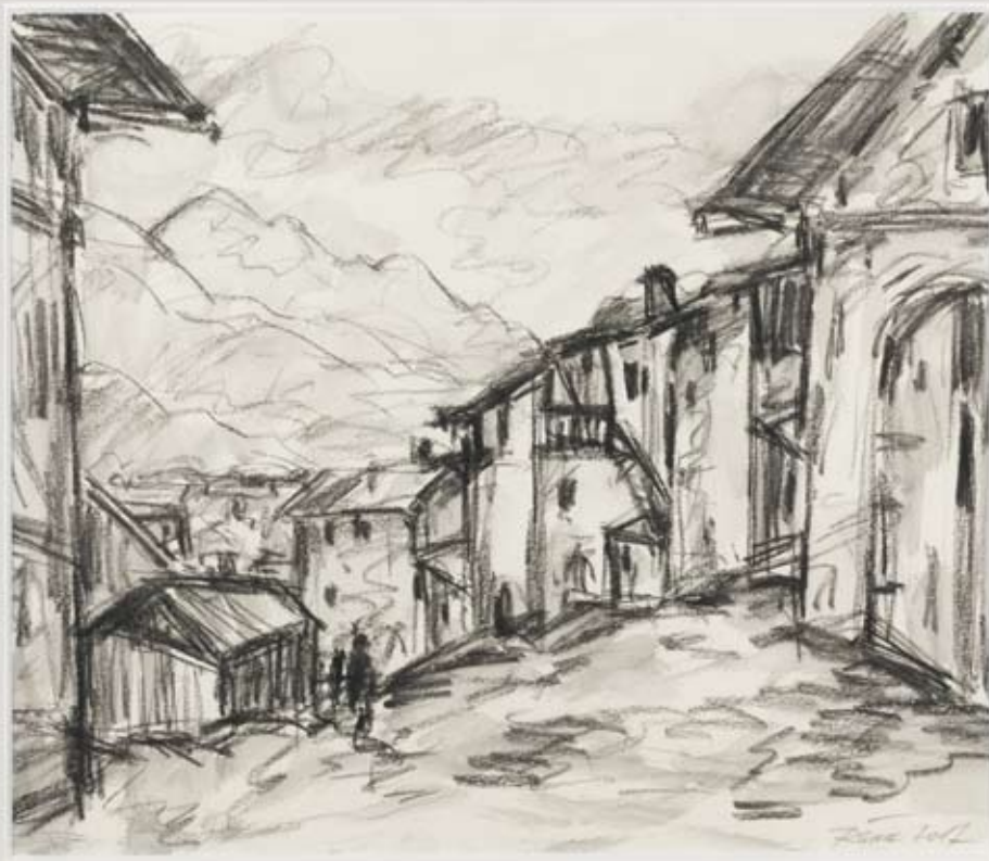
7 Mühlgassl, Kohle Papier, ca. 39 x 32 cm