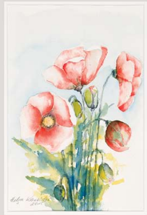
2 Mohnblumen, Aquarell Papier, 20 x 30 cm