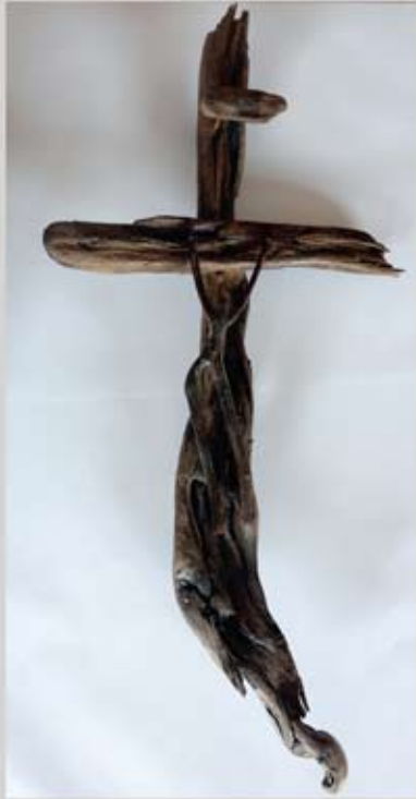
10 Kruzifix, Holz, ca. 34 x 70 cm