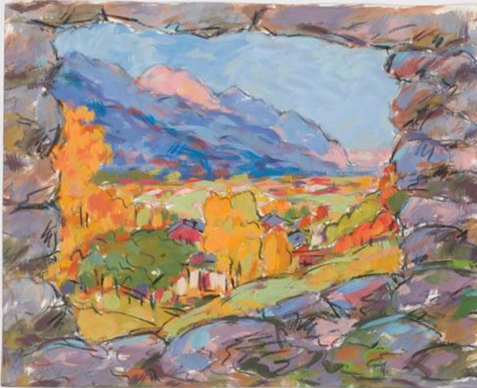
6 Im Nussgartl, Tempera, Kohle Papier, ca. 39 x 31 cm