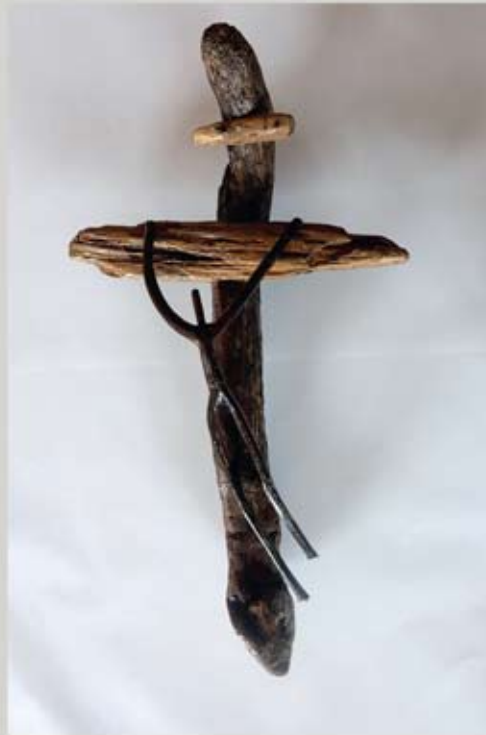
11 Kruzifix, Holz, ca. 29 x 46 cm