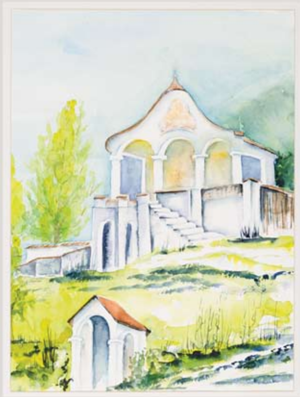
3 Kalvarienberg, Aquarell Papier, ca. 30 x 40 cm