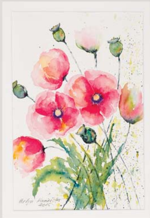
1 Mohnblumenstrauß, Aquarell Papier, 20 x 30 cm